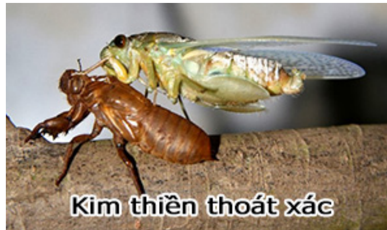
Kim thiên thoát xác

+ Diễn cố: Trong Trận Phì Thủy, sau khi nhận thấy quân Tần rối loạn sau đợt tấn công phủ đầu của quân Tấn, Tạ Huyền quyết định tận dụng thời cơ tung toàn lực tấn công, kết quả là quân Tần đại bại dù đông quân gấp 10 lần quân Tấn.