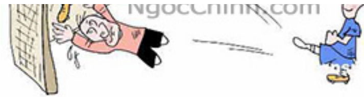
Dương Đông Kích Tây