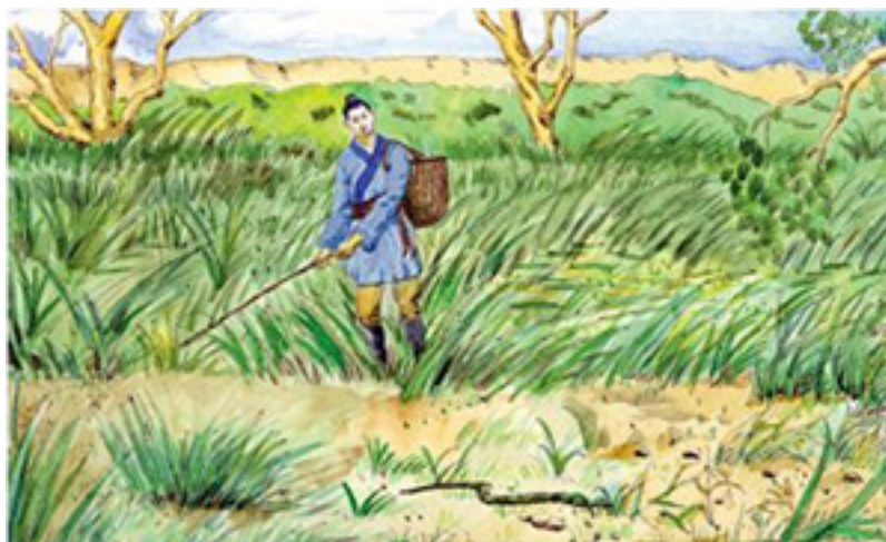
Đả Thảo Kinh Xà