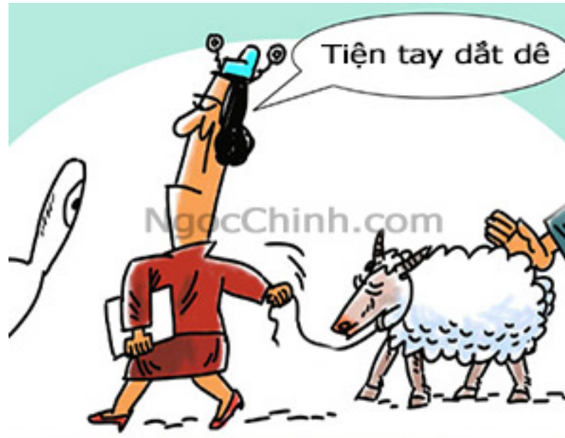
Tiện tay bắt dê

- “ Lý đại đào cương ” là đưa cây lý chết thay cho cây đào. Người lớn làm họa, bắt người bé chịu tội thay. Có rất nhiều kẻ tác gian phạm tội lại bắt người khác thế thân.