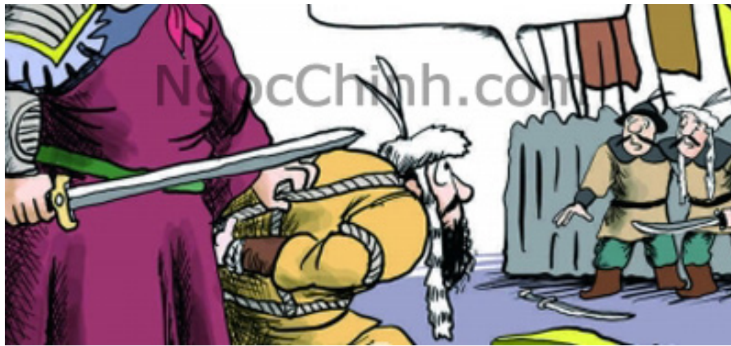
Bắt Giặc Bắt Vua